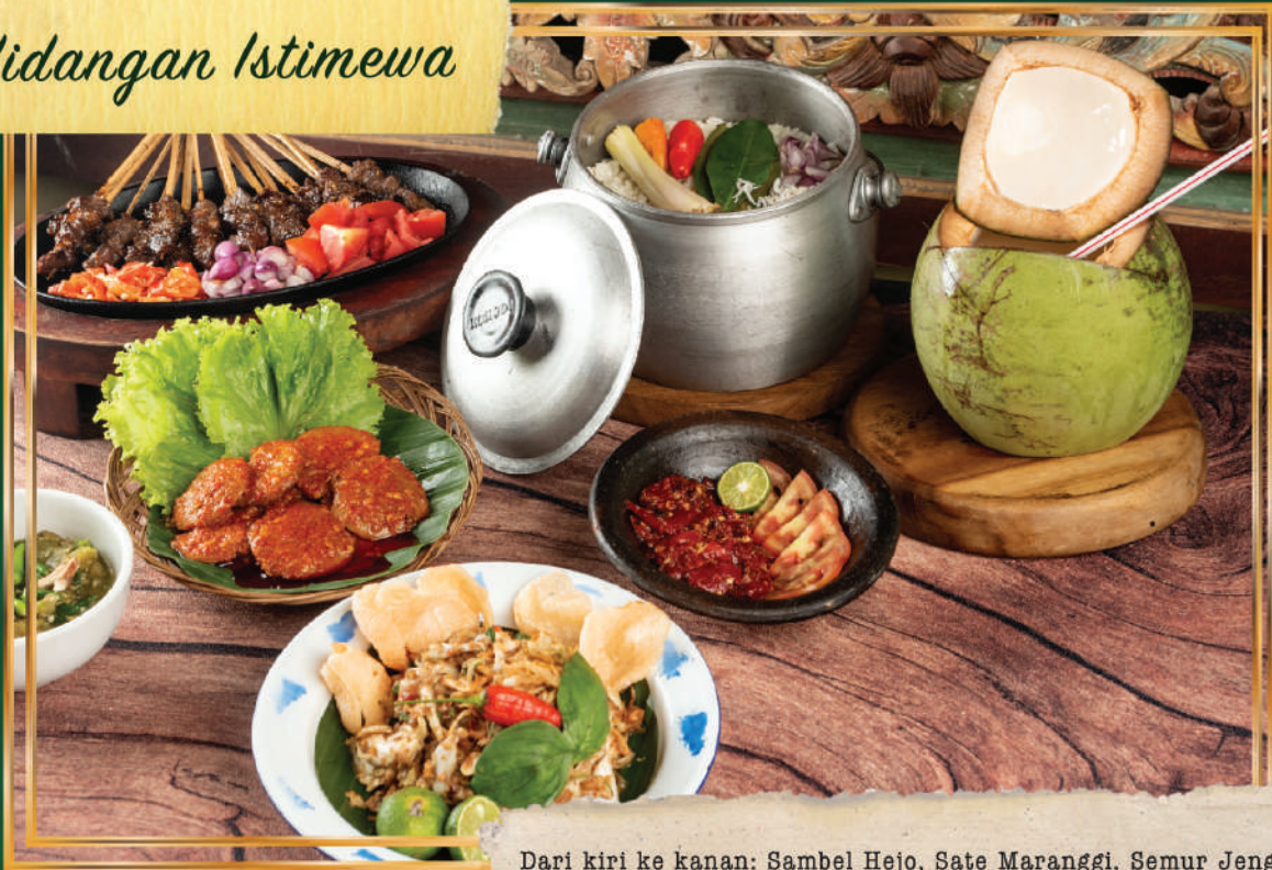
Dari kiri ke kanan: Sambel Hejo, Sate Maranggi, Semur Jengkol, Karedok, Nasi Liwet, Sambel Dadak, Kelapa Batok.