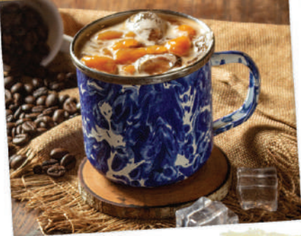
Kopi Susu Kaung

Kopi Susu Kaung merupakan kopi khas dari La Mare yang diracik oleh barista-barista andal. Meski boleh dibilang seperti kopi kekinian, cita rasa tradisional dalam Kopi Susu Kaung sangat terasa di lidah.